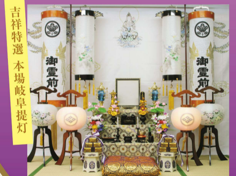
吉祥特選 本場岐阜提灯

故人の供養として、仏様にいただいた提灯は、燈火を絶やさず、写真のように調和よく飾ります。