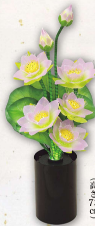
ルミナス ラージハス